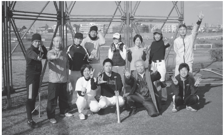
メンバーも常時募集しております!!