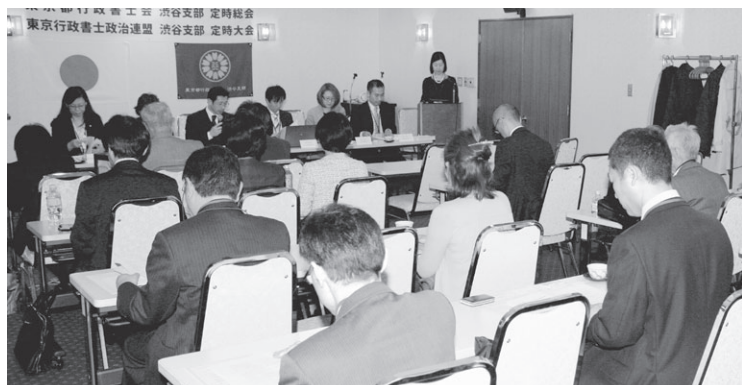
会員の皆さまによって活発な審議がなされました