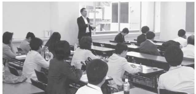
相談終了後の事例検討会は、とても勉強になります