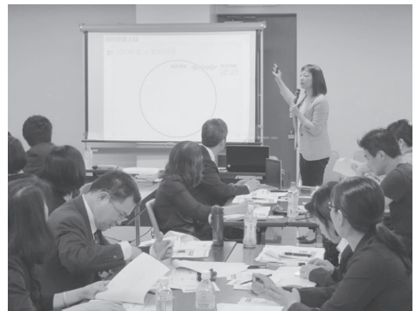
今回はいつもと違って4人ずつのグループ形式で行いました。