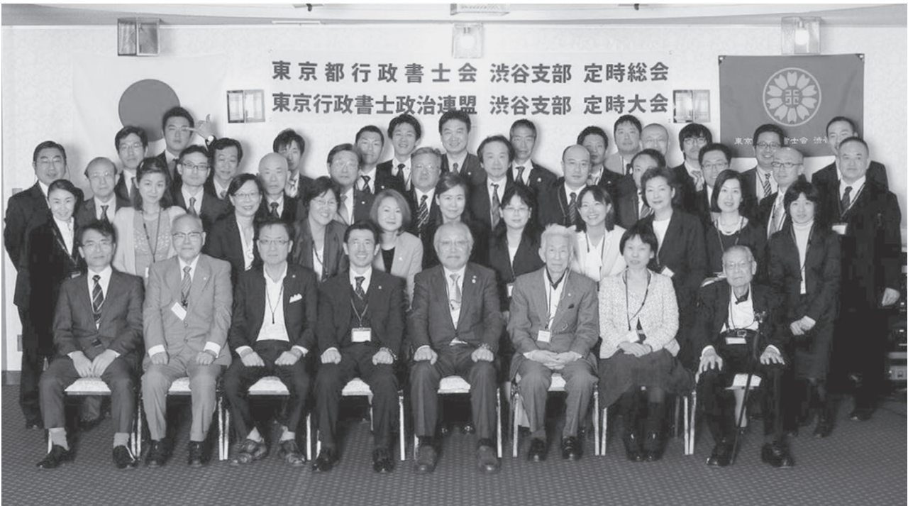
26年度も明るく楽しい渋谷支部でいきます！

定時大会の後は懇親会です。田中国清先生による乾杯の音頭により懇親会が始まりました。新人会員からベテラン会員まで、同じテーブルを囲み、和気あいあいとした雰囲気の中での立食パーティーとなりました。出席していた表彰会員からそれぞれの在籍期間を振り返ってのコメントをいただいたり、新会員に自己紹介をしていただいたりと、会員相互のコミュニケーションを図るという目的を達成し、大いに盛り上がった懇親会となりました。 (広報部 石橋 俊之)