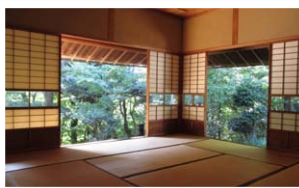
数寄屋風書院造の応接空間杉の間