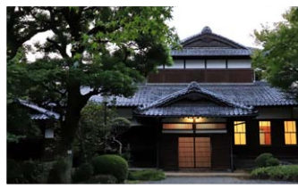
三州瓦葺き美しい強いむくり屋根が特徴の玄関

旧朝倉家住宅は、主屋、土蔵が重要文化財で、木造二階建ての母屋と回遊式庭園を見学することができ、四季折々の景色が楽しめます。