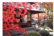
庭園のイロハモミジ

(重要文化財 旧朝倉家住宅 | 渋谷区公式サイト (city.shibuya.tokyo.jp) https://www.city.shibuya.tokyo.jp/shisetsu/bunka/asakura.html )